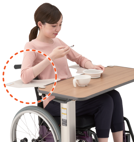
〔ベッドサイドテーブル PT-7000F+ 笑テーブル〕