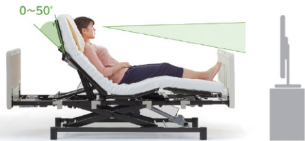
0～50度まで調整可能な「QOLポジション」